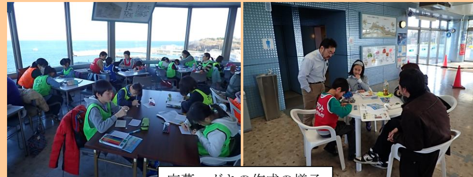
応募ハガキの作成の様子

1月7日（土）、『「ハガキにかこう海洋の夢コンテスト」はがき作成会と親子餅つき大会』を開催しました！